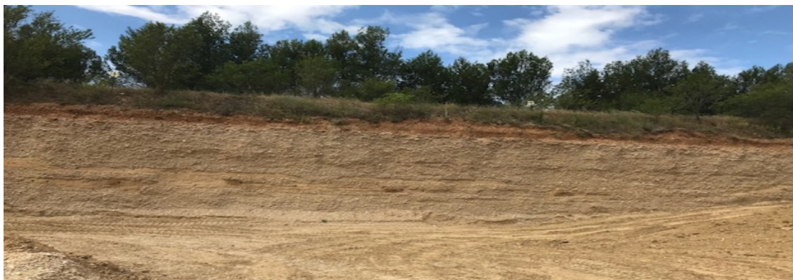
( front abritant plusieurs nids des Guépier d'Europe ( Merops apiaster )