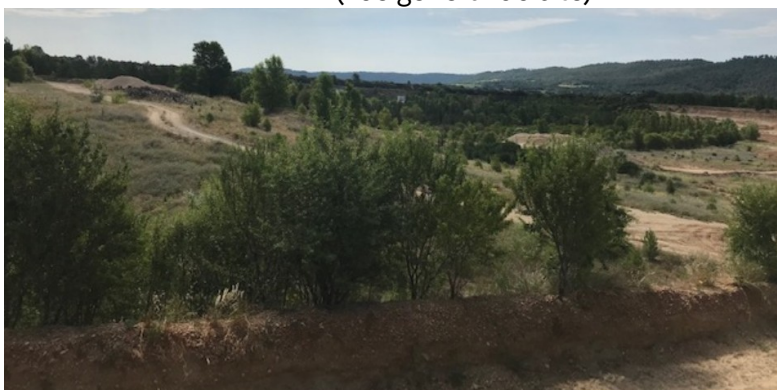
( partie du site complanté d'essences d'arbres)