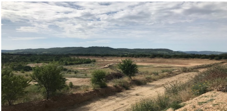
(vue général du site)

1) Le dossier de demande d'autorisation prévoit pour le réaménagement de la carrière la plantation d'essences d'arbres adaptées aux conditions climatiques de la région méditerranéenne et dont l'objectif est d'apporter un intérêt écologique au site dont la vocation est un usage naturel. L'exploitant doit, sous 3 mois, porter à la connaissance de Mme la Préfète la modification des conditions de remise en état avec tous les éléments d'appréciation nécessaires, conformément aux dispositions de l'article R.181-46 du code de l'environnement. En outre, le dossier devra préciser les mesures prises pour assurer la protection des intérêts visés à l'article L. 511-1 du code de l'environnement.