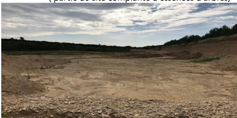
( partie à remettre en état)

2) Dans le même délai, il devra s'assurer que les mesures à mettre en oeuvre pour la conservation des Guépriers d'Europe ( Merops apiaster ) , espèce protégée par l'arrêté du 29/10/2009 soient toujours pertinentes. Pour ce faire, il prendra attache avec un bureau spécialisé en écologie. Le travail à effectuer s'articulera autour des axes suivants: