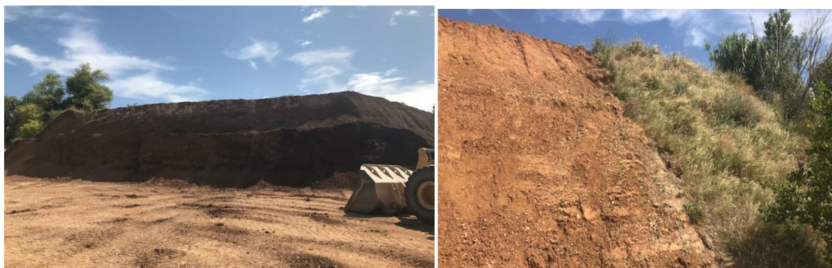
(stock de découverte installé chez la société "Bergier Valorisation")

Aucun risque d'accident majeur n'est répertorié dans l'étude de danger suivants les dispositions de l'arrêté du 19/04/2010.